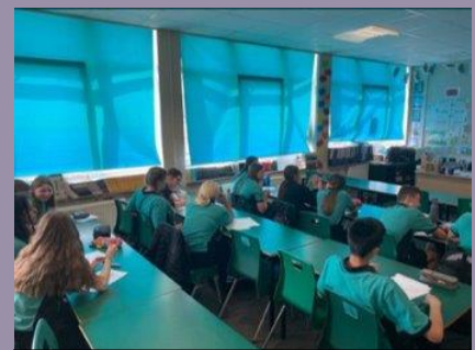
Myfyrwyr yn mwynhau un o sesiynau Cymru Ni