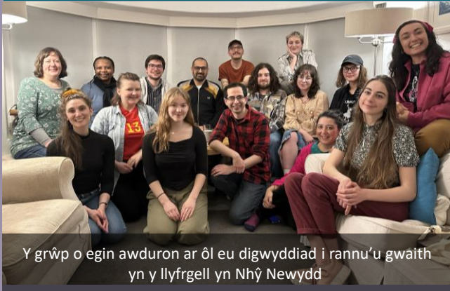
Y grŵp o egin awduron ar ôl eu digwyddiad i rannu'u gwaith yn y llyfrgell yn Nhŷ Newydd