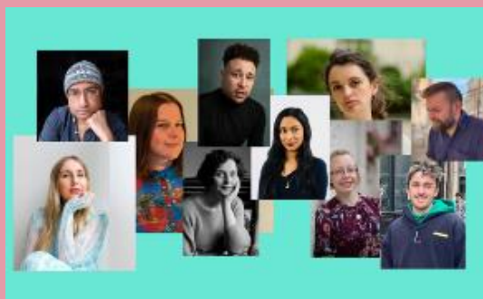
Cyhoeddodd Gŵyl y Gelli enwau'r awduron llwyddiannus a ddewiswyd ar gyfer y rhaglen Awduron Wrth eu Gwaith