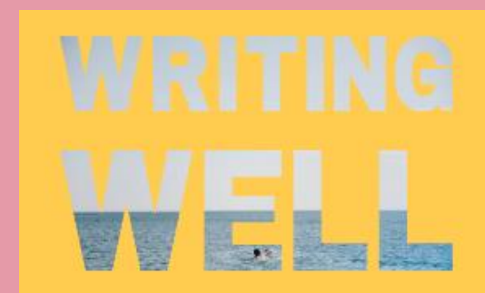
Lansiodd Llenyddiaeth Cymru gyfle datblygu newydd i hwyluswyr llenyddol