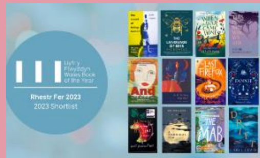
Cyhoeddwyd rhestrau byrion Gwobr Llyfr y Flwyddyn yn Gymraeg a Saesneg