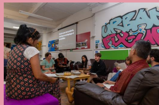
Cynhaliodd LUMIN Syllabus ddwy sesiwn fel rhan o brosiect Llên mewn Lle