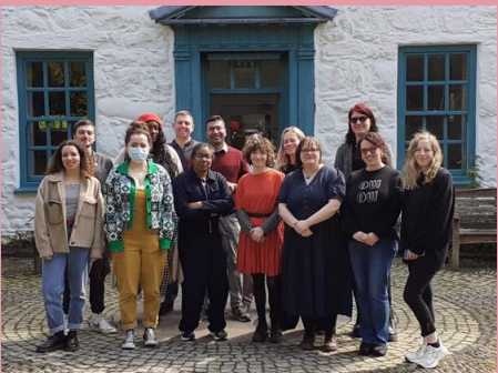
Cyhoeddwyd enwau grŵp o awduron 3 rhaglen Cynrychioli Cymru a chynhaliwyd eu dosbarth meistr cyntaf fis Ebrill