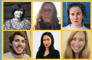
Chwe hwylysydd llenyddol ar fin dechrau rhaglen ddatblygu dwys dros y 12 mis nesaf