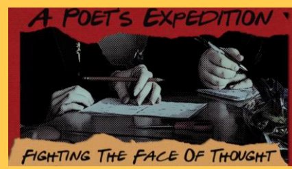
Duke al Durham yn cnoi cil am ei gyfnod preswyl 6 mis yn Ysgol Uwchradd Bassaleg fel rhan o brosiect Darn-Wrth-Ddarn.